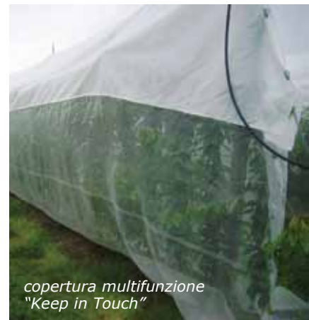
copertura multifunzione "Keep in Touch"

Le prime esperienze riguardo all'uso di questo tipo di reti sul melo sono state condotte in Francia da alcuni tecnici, i quali ne hanno anche coniato la definizione: metodo "Alt'Carpo". La pratica messa a punto dai francesi consiste nel coprire il frutteto con una rete a maglia più stretta dell'antigrandine classica in modo da isolarlo dagli attacchi esterni degli insetti (carpofagi in particolare). Le soluzioni studiate sono due: nella prima (monofilare) ogni singolo filare è ricoperto dalla rete; nella seconda (mono-